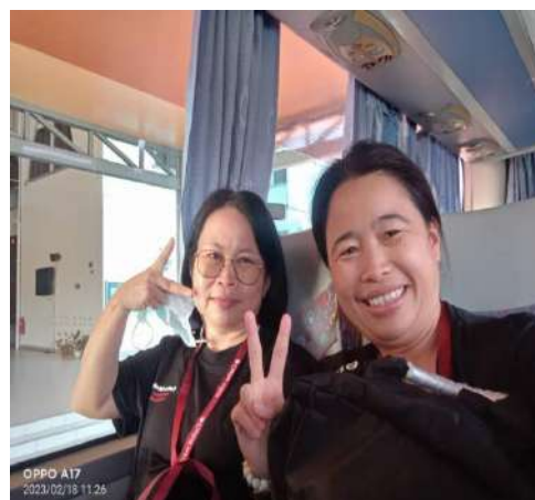
LAWATAN SAMBIL BELAJAR KE TZU CHI, LIKAS KOTA KINABALU - KUMPULAN 2