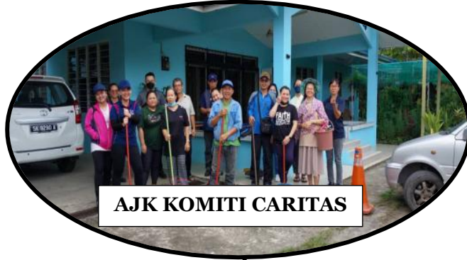
AJK KOMITI CARITAS