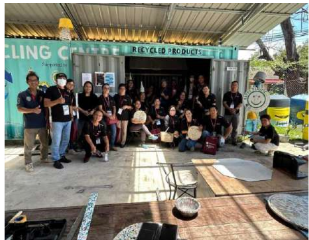
LAWATAN SAMBIL BELAJAR KE RIPPLE, SABAH RECYCLE CENTRE - KUMPULAN 1